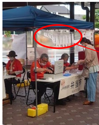
メニュー表設置のイメージ